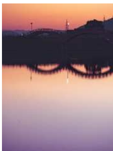
『夕刻のリフレクション』 大川 智之様