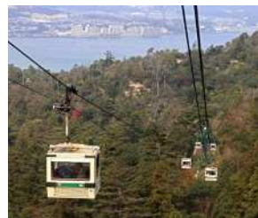
『弥山へのみち』 中澤 俊之様