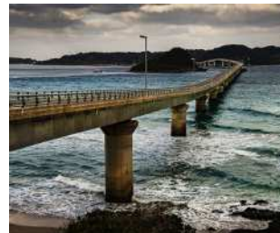
『果てしなく続く』 横山 周作様