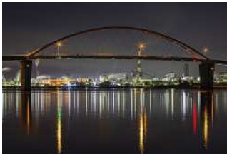
『周南コンビナートをつなぐ』 内山 省三様