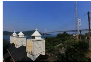
『今も見守る灯台達』 山台 雄三様