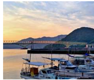
『朝日に映える大島大橋』 上杉 裕昭様