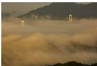
『霧海に浮かぶ安芸灘大橋』 大森 富美男様