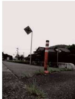
『孤立』 安井 志歩様