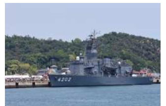
『マリンフェスティバル』 中戸 洋子様