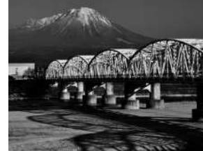
『麗美共演』 宇田川 洋二様