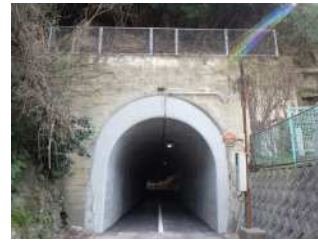
『これからまた 50 年先も』 妹尾 優大様