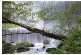
『名水のカーテン』 奥広 淳一様