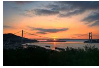
『朝日を包む雄大橋』 斎藤 雄幸睦様