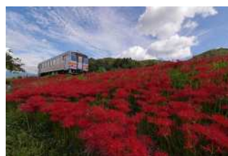
『赤い野を走る』 森川 清美様