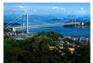
『碧海を跨ぐ瀬戸大橋』 福田 尚人様