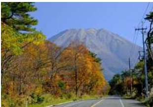
『大山へ』 木下 正治様