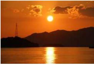
『尾道水道の鉄塔』 柴田 武秀様