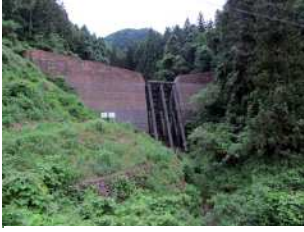
『鉄壁の守り』 藤利 充宏様