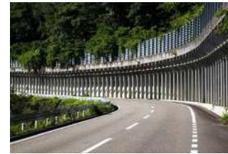
『備えのデザイン』 内山 省三様