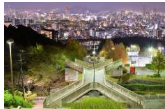
『竜王公園と秋の夜景』 山代 雅和様