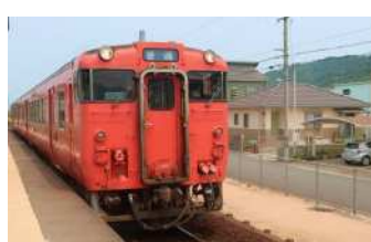
『いつもありがとう』 小川 華奈様