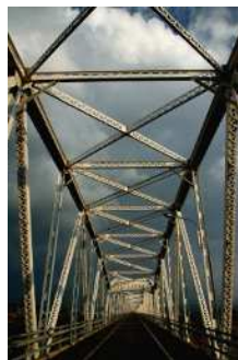
『風雪に耐え』 宇田川 洋二様