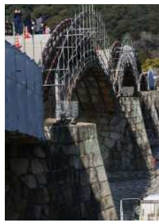
『守られる歴史ある建 造物』西明 美恵子様