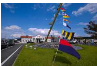
『海風にはためく』 森川 清美様