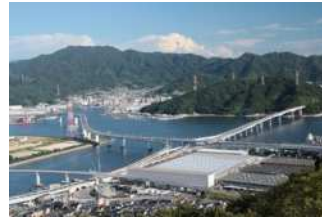
『海上の道路』 堀越 正和様