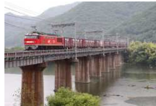
『万富鉄橋』 中戸 洋子様