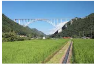
『広島空港大橋』 堀越 正和様