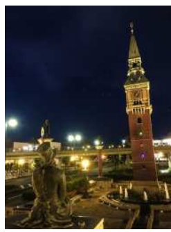
『夢の続き』 松永 亜紀子様