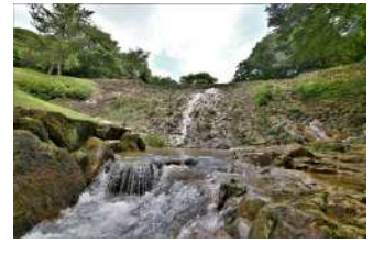
『砂防ダム』 林 隆義様