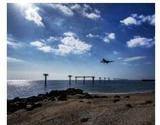
『間もなく着陸』 横山 周作様