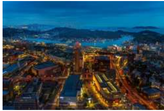
『雨の小瀬戸湾』