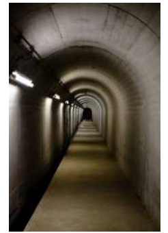
『コンクリートの迷路』 木下 正治様