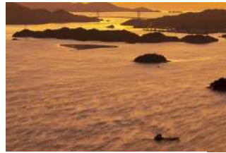
『冬のしまなみ海道』 大森 富美男様