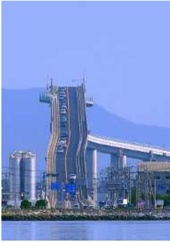
『空に登る道』 門脇 正晃様