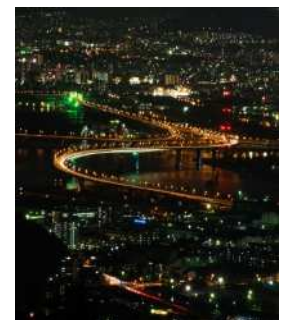
『帰り道』 村上 泉様