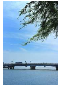
『松江大橋』 児島 巧様