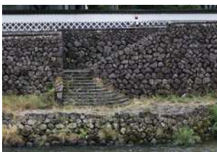
『津和野川を守る石垣』 大野 雅夫様