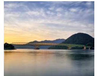
『朝日に輝く大島大橋』 上杉 裕昭様