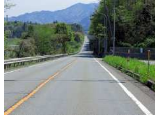
『気持ちが高揚する』 藤利 充宏様