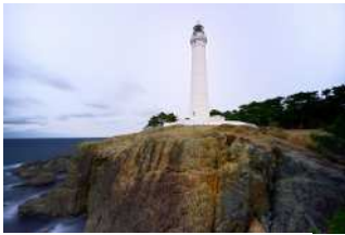
『出雲日御碕灯台』 児島 巧様