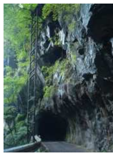
『雄々しき道』 横山 智康様