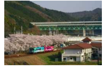
『高速道路、新幹線、そして 地域を守る三セク鉄道』 笠井 忠様