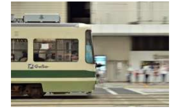
『広島市民の足』 中尾 亮太様