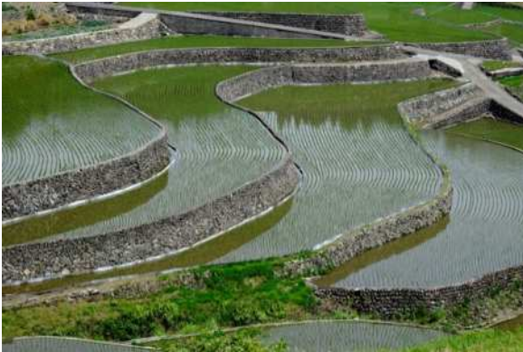
タイトル：曲線美 応募者名：木下 正治様 作品コメント：

日本棚田 100 選の「井仁の棚田」を撮影場所を選びに行ってきました。山間の細い道路を進みトンネルを抜けた所にその棚田が在りました。山に囲まれた急な高低差にその棚田の美しい存在感は圧巻でした。この日は田植えを終えた時期でその優美さ最高のご褒美でした。