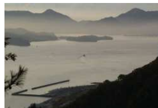
『始発フェリー島を結ぶ』 系賀 一典様