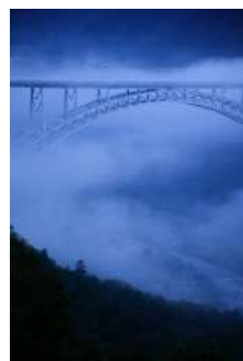
『僕を忘れないで』 奥広 淳一様