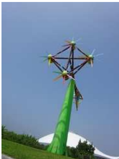
『あの時の風と』 江藤 珠己様