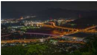
『オレンジの河』 指田 丈二様