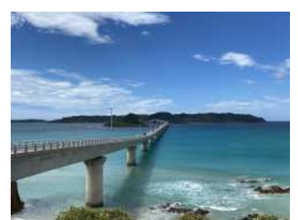
『日本の誇り』 馬淵 亮太郎様