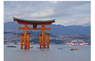
『大鳥居』 村上 泉様