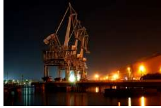
『真夜中の舞踏会』 田中 雅之様