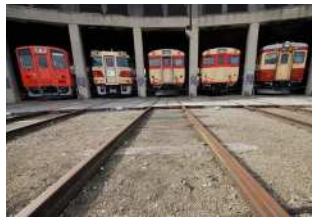
『機関車庫』 津田 篤志様