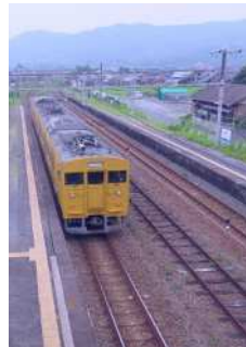
『止まらない』 田中 桜花様