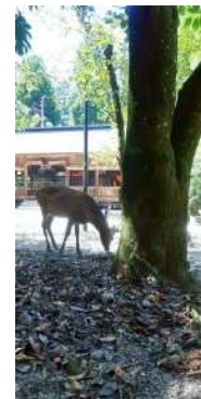
『大元神社』 神本 彩花様