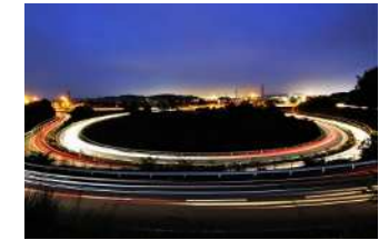
『玉島インター夜景』 林 千寿様