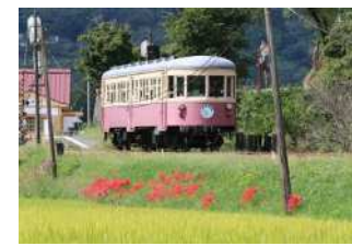
『秋の片上鉄道』 高井 良暢様