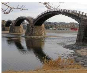
『錦帯橋』 中澤 俊之様