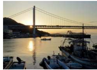
『静かに出漁』 富所 上様