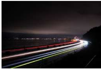
『水の都に続く道』 朝元 政貴様