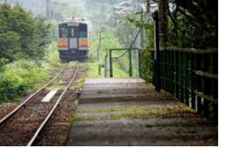
『ノスタルジックな光景』 田中 雅之様