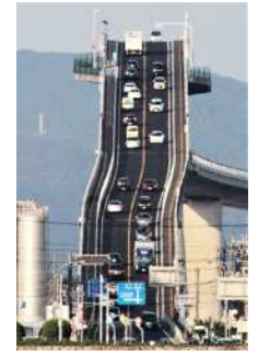
『江島大橋』 林 隆義様