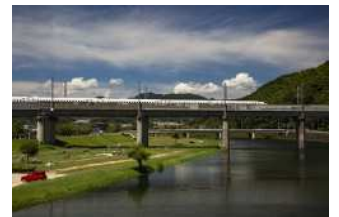
『夏を運ぶ』 内山 省三様