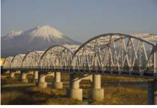
『ふるさとの日野橋』 樋口 輝久様