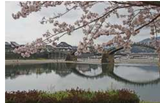
『春』 村上 泉様