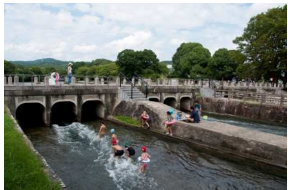
タイトル：酒津の夏 応募者名：樋口 輝久様 作品コメント：

錦帯橋をすっきり見せる為に、早朝一番に撮影しました。錦帯橋だけでは少し寂しい景色と成るために、手前に菜の花と和船を脇役にして撮影しました。