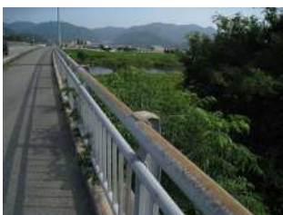
『一緒に帰ろう』 安井 怜海様