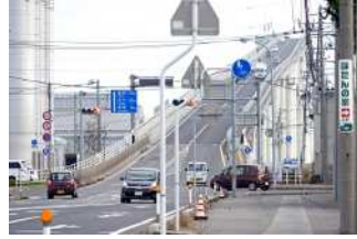
『天まで上れ』 田中 雅之様