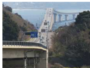
『角島大橋の曲線』 太田 明様