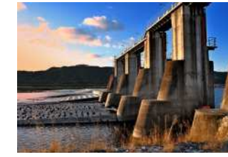
『夕日に輝く堰』 斎藤 雄幸睦様