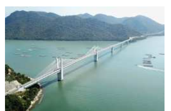
『備前♡日生大橋』 中戸 勝美様