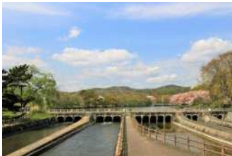
『酒津疏水』 林 千寿様