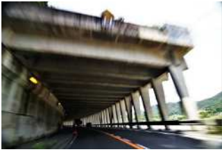
『美袋(みなぎ)洞門』 林 隆義様