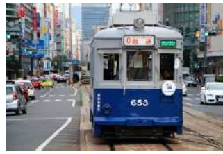
『被爆電車 653号』 橘川 春海様