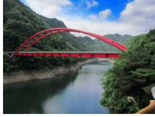
『渓谷に映える』 藤利 充宏様