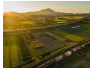
『我が町のシンボルたち』 山根 大樹様