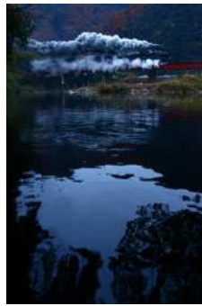
『汽車旅、右に清流左に紅葉』 杉野 蒼空様