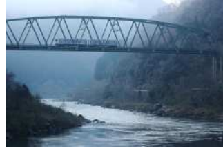
『霧中瞬景』 杉野 蒼空様