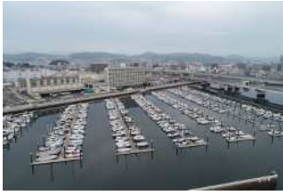
『吉島BPの風景』 藤原 拓哉様