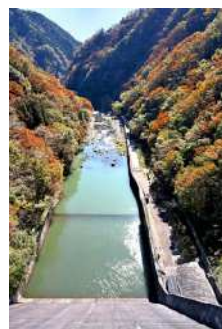
『紅葉に包まれて』 斎藤 雄幸睦様