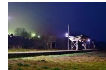
『小さくなくても役目は同じ大切 な場所』松嶋 晃矢様