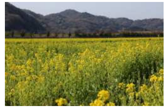
『菜の花畑と国道2号線』 迫 結月様