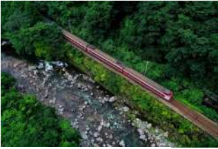
『自然と共に』 南端 祐希様