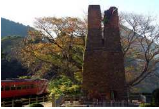
『晩秋の反射炉』 中川 雄喜様