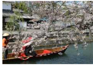
『春の倉敷川』 迫 結月様