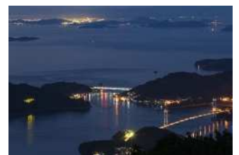
『夜のとびしま海道』 大森 富美男様