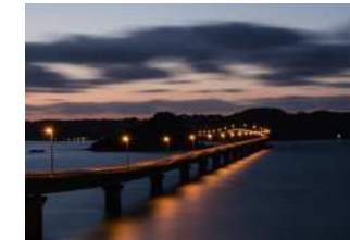
『角島大橋ライトアップ』 清水 靖久様