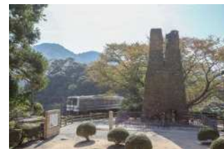
『革命遺産』 松尾 柊太郎様