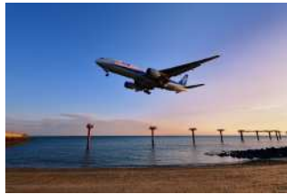
『海の上の進入灯』 弘中 伸治様