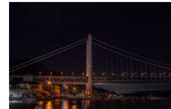
『夜の漁港に佇む瀬戸大橋』 横山 美紅様