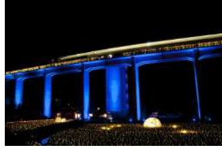
『最終列車』 樋口 輝久様