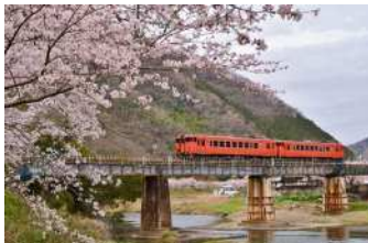
『桜咲ク路(さくらさくみち)』 松嶋 晃矢様