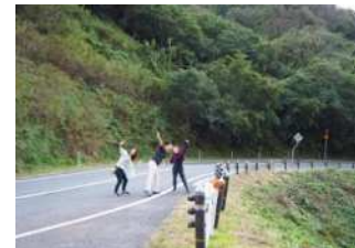
『道路で記念撮影』 飯野 晴香様