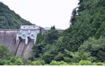
『残そう豊かな水源』 村田 彩様