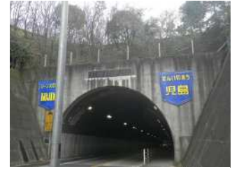
『国産シーズ発祥の地』 妹尾 優大様