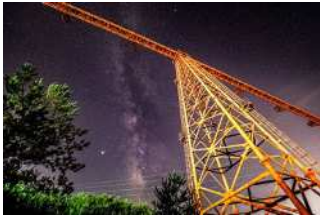
『宇宙（そら）への旅路』 奥広 淳一様