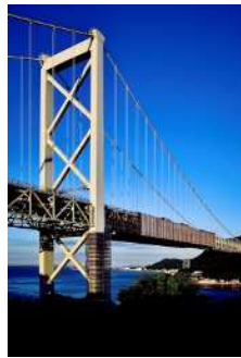
『大地と未来を繋げる 橋』松尾 藍花様