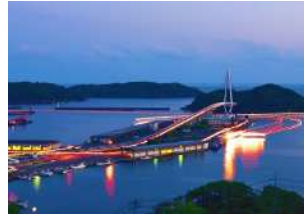
『夜のマリン大橋』 鹿島 和生様