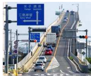
『ベタ踏み坂』 平野 ひろ子様