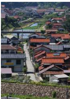
『津和野川に沿う街並み』 大野 雅夫様