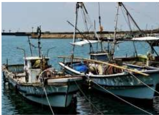
『かけろう』 三戸 律子様