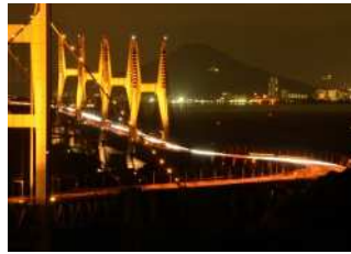
『黄金の大動脈』 富所 上様