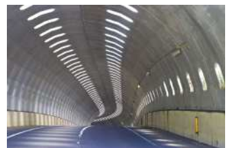
『光窓』 田部 明芳様