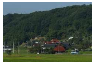
『夏の田舎町を走る』 杉野 蒼空様