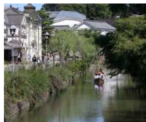
『江戸・明治の風情が残る 倉敷川畔』 中澤 俊之様