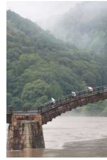
『錦帯橋を渡り通学する 児童』西明 美恵子様