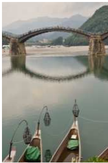
『アユの住む清流』 國重 始様