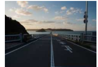
『角島大橋』 清水 靖久様