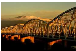
『夕照』 宇田川 洋二様