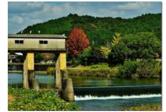
『良い眺めだな』 三戸 律子様