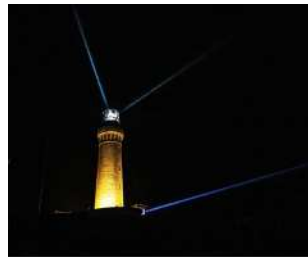
『航路は安全』 横山 周作様