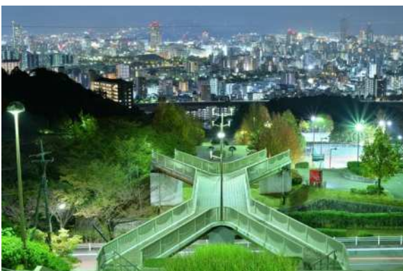
タイトル：竜王公園と秋の夜景

夏になると子供達のはしゃぐ声が酒津に戻ってきます。何とも気持ちよさそうです。見ているだけで、こちらも楽しくなってきます。子供達の夏の遊び場となっている酒津南配水樋門は、高梁川の改修工事ともなって大正 14 年に完成した灌漑施設で、現存する国内最大級の灌漑樋門であり、国の重要文化財です。そんなスゴイところだとは、子供達は知らないだろうな。いつまでも倉敷の夏の風物詩であって欲しいと思います。